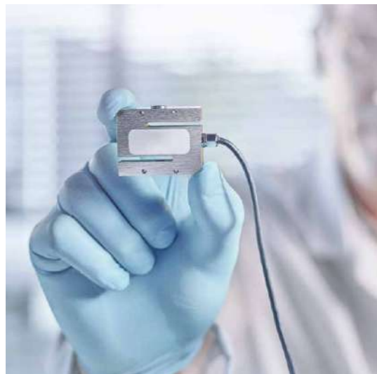
Динамическая квалификация всего диапазона жесткости без статических эталонных весов

Запатентованная система SmartCal™ использует единый сертифицированный контрольный груз в нескольких положениях для изменения силы, действующей на тензодатчик ST50. Процедура квалификаций с помощью меню позволяет выполнять точную настройку и проверку при различных нагрузках. Калибровка не требует какой-либо (частичной) разборки тестера или укладки нескольких эталонных грузов.